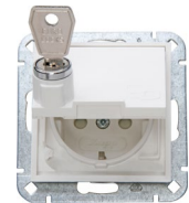
Dank der Abschließmöglichkeit behalten Anwender die volle Kontrolle.