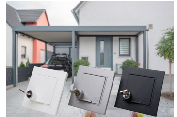
HK07: Die abschließbare Schutzkontaktsteckdose ist in drei Farben erhältlich.