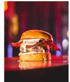
Möge die beste Burgerkreation gewinnen.