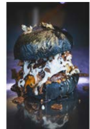
Die Lebensmittel aller Burger stammen aus nachhaltiger Herstellung.