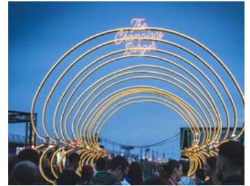
An allen Festivaltagen wird es ein tolles Rahmenprogramm geben.